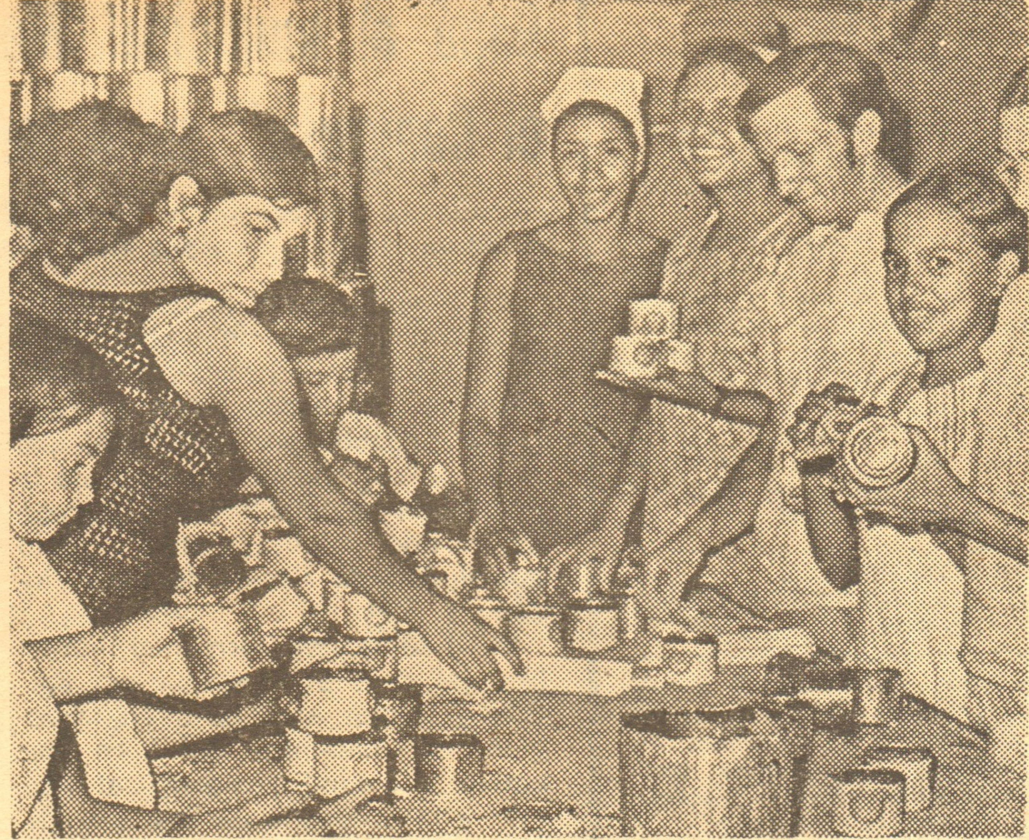
Quando la máquina de etiquetar se rompe o no da abasto, los CDR brindan su apoyo. Un grupo de cederistas realizan esa labor en forma voluntaria.