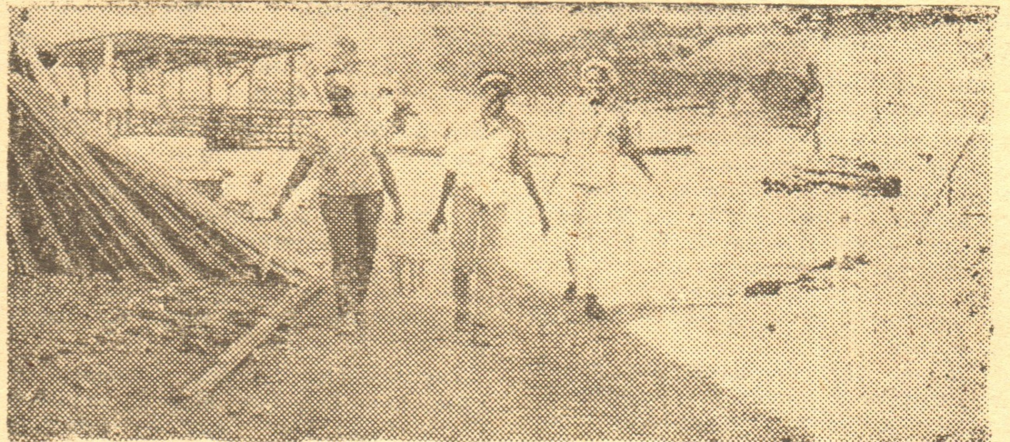
La mujer junto al hombre en la construcción

"La mujer vivirá a la par del hombre como compañera y no a sus pies como juguete hermoso", dijo