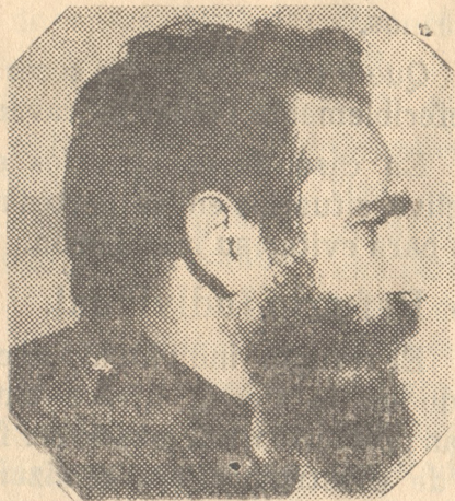
■ ASCENDIDOS 1848 OFICIALES

"Nos proponemos crear un ejército de reserva muy poderoso, bien organizado", expresó anoche el Comandante Fidel Castro en el acto celebrado en Playa Girón con motivo de conmemorarse el séptimo aniversario de la Victoria de Girón.