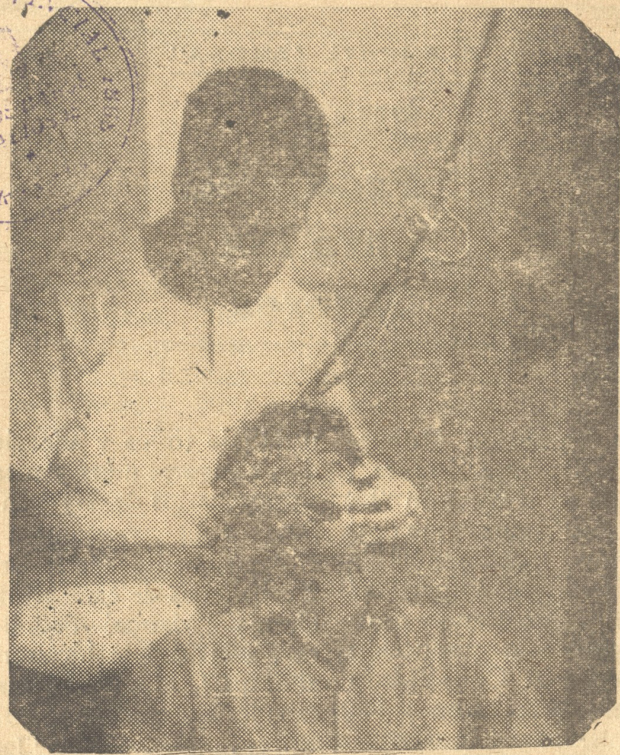
PLANTA DE MOLDEO VERTICAL:

Su construcción es de Asbesto Fibrocemento, con piso de cemento. La tarea de construcción de este nuevo Policlínico fue planteada por el Núcleo del PCC del MiCons que radica en ese lugar, debido a la necesidad existente en la zona; aunque desde el mes de noviembre funcionaba uno, pero sin las condiciones de éste. El mismo ha resuelto un gran problema, pues los vecinos de esta zona tenían que trasladarse hasta Victoria de las Tunas o Bayamo para comprar las medicinas necesarias y que son adquiridas ahora en la Farmacia de éste. • Raúl Tamayo